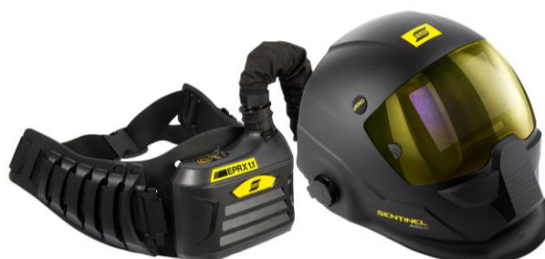
EPR-X1.1 z przyłbicą z systemem wentylacji Sentinel A60