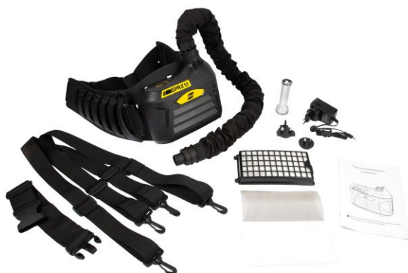
System respiracyjny (PAPP) EPR-X1.1

Więcej informacji znajdziesz w witrynie esab.com .