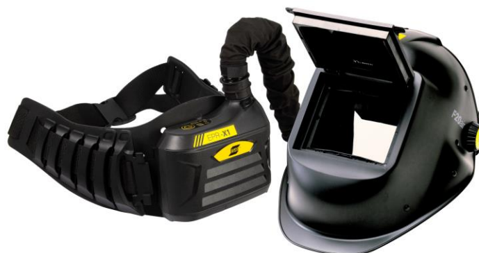
F20 Air z EPR-X1 firmy ESAB