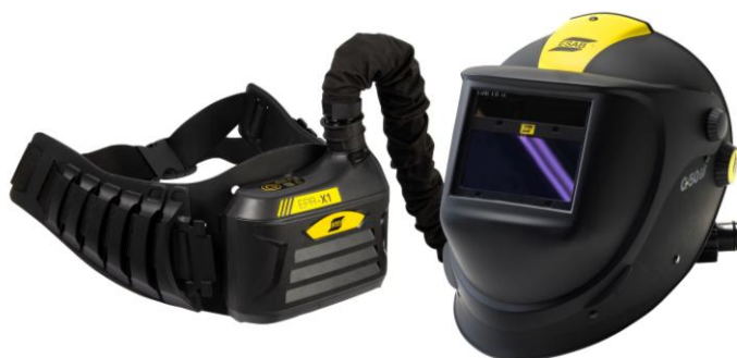
G50 Air z ESAB PAPR