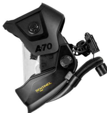
Sentinel A70 Air PRO