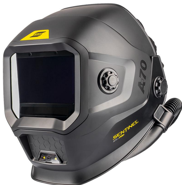
Sentinel A70 Air PRO