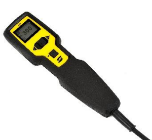
ER 1 – wielofunkcyjny zdalny sterownik z wbudowanym wyświetlaczem