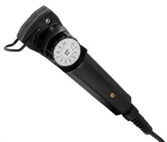
MMA 3 – tradycyjny zdalny sterownik do regulacji natężenia prądu