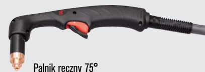
Palnik ręczny 75°

(więcej opcji palników można znaleźć w witrynie www.hypertherm.com )