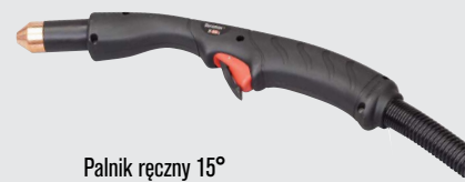
Palnik ręczny 15°